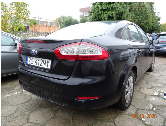
Widok ogólny samochodu