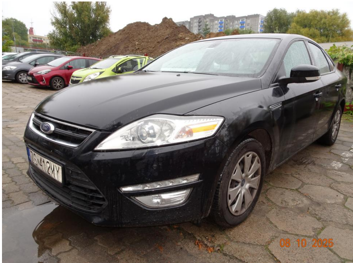
Widok ogólny samochodu