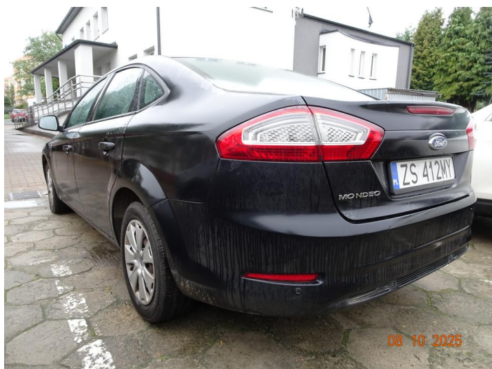
Widok ogólny samochodu