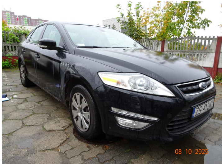
Widok ogólny samochodu